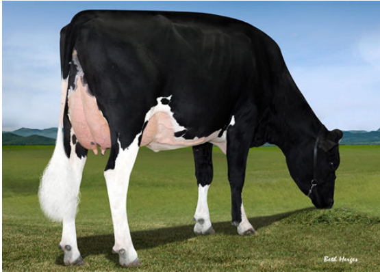
FAIRMONT TUFFENUFF RIDGE THIRD DAM